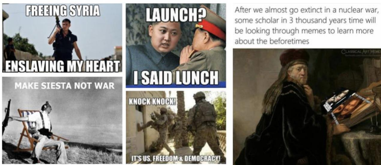
Figuras 12 a 17. imagen y guerra. De izquierda a derecha. Arriba; meme de la serie realizada a partir de este soldado del ejército rebelde sirio que generó sensación en EEUU (por lo atractivo). Abajo, retomando la famosa fotografía de R. Capa,