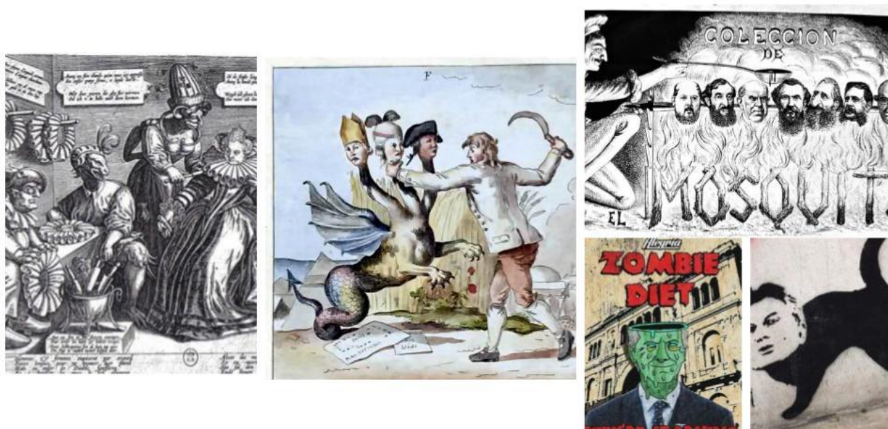
Figuras 1 a 5. Imágenes propias de la risa satírica. De izquierda a derecha: vanitas , taille-douce , Flandes, siglo XVI; Au second ordre de l'etat , Francia, 1799; publicación argentina satírico-burlesca El Mosquito (1863-1893). Las cabezas siendo asadas son de figuras políticas ilustres de Argentina, entre ellas ex presidentes como B. Mitre y F. Sarmiento. Abajo: ilustración del grupo satírico Alegria , del presidente argentino M. Macri transformado en zombie , publicado en Facebook en 2018; graffiti callejero que muestra al presidente argentino M. Macri con cuerpo de gato (como lo denominan sus detractores), Buenos Aires, 2018.