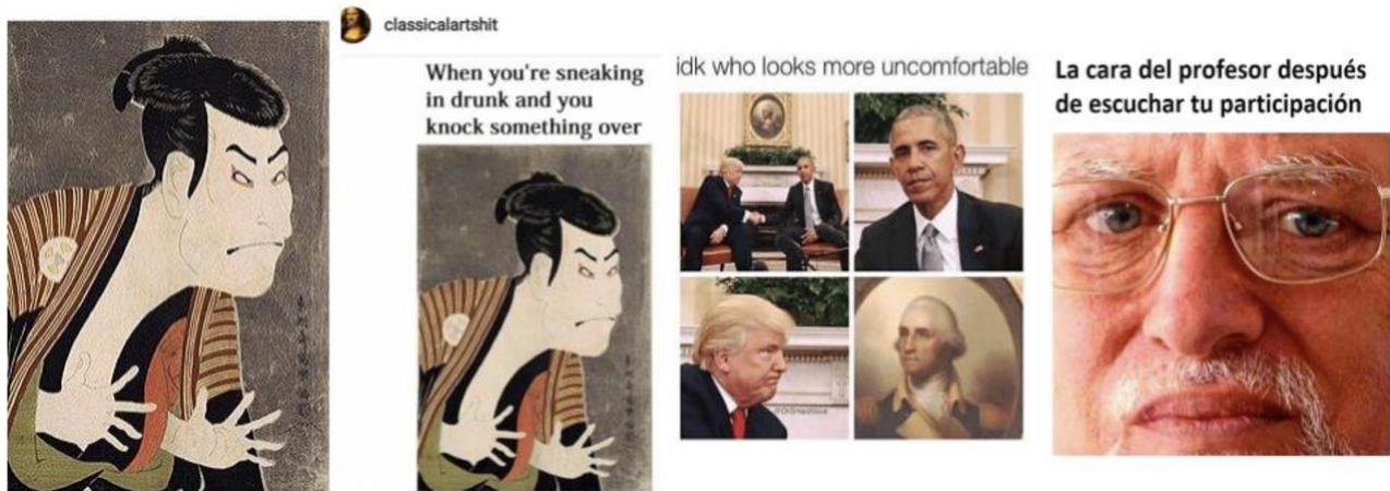
Figuras 6-9: casos de cristalización de las emociones en su máxima intensidad (condensación). De izquierda a derecha: instante del mié en el teatro japonés, retomado por P.A. Michaud, ilustración 1794 y al lado el mismo dibujo utilizado en un meme de la página de Instagram classicalartshit que utiliza obras de arte en clave humorística. A continuación, de esa misma página web, montaje con D. Trump y B. Obama dando cuenta del malestar en la reunión e involucrando el retrato de la casa presidencial de G. Washington. Finalmente, un caso de Harold, Hide the pain , célebre meme que implica siempre una situación de sufrimiento.

Finalmente, algunos memes funcionan en tanto se piense su potencia vinculada a la capacidad de condensar emociones (al igual que ocurre con los GIFs, y más aún en su caso, como propone Gutiérrez De Angelis 2016) y aquí es posible pensarlas dentro de la historia de las emociones figuradas que propuso en su momento Aby Warburg (en Didi-Huberman 2016). En este sentido, resulta interesante pensar la conexión entre las fórmulas de la emoción que Warburg pensaba ( pathosformeln ) a partir de una propuesta de Philippe-Alain Michaud (2017) que conecta estas emociones en movimiento, que a su vez se cristalizan en su momento de mayor intensidad, con las expresiones propias del teatro japonés kabuki denominadas mié : la inmovilidad viviente que captura un momento de tensión particular, como punto culminante de la expresividad. Se destacan entonces esta capacidad de condensación (el lirismo del gesto, en términos de Didi-Huberman), la cristalización de las emociones en su momento de mayor intensidad y su impacto crítico y satírico propio del activismo político.