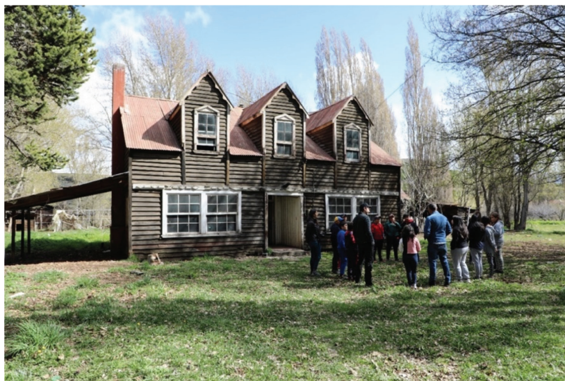
Figura 2: Trabajo con alumnos del colegio Valle de la Luna en inmueble erigido circa de 1913, localidad de Ñirehuao, comuna de Coyhaique, región de Aysén. Imagen digital (2022).