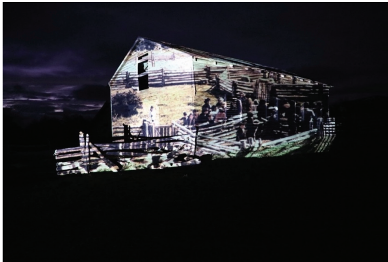
Figura 3: Proyección de una fotografía de la familia Ehijos trabajando en los corrales con ganado ovino, sobre fachada exterior en galpón, propiedad de Soledad Solís Ehijos, comuna de Coyhaique, región de Aysén. Imagen digital (2022).