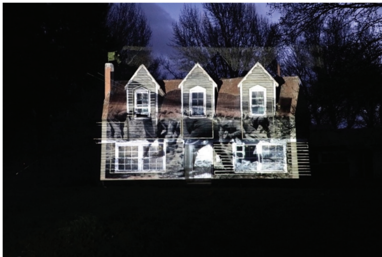
Figura 4: Proyección de una fotografía antigua de trabajadores estancieros durante la señalada de ovinos sobre fachada exterior de la antigua casa de administración de la Estancia Ñirehuao, propiedad de Marcos Peede Maluenda, comuna de Coyhaique, región de Aysén. Imagen digital (2022).