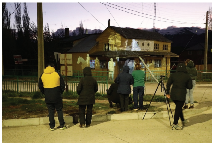
Figura 9: Pobladores/as de la localidad de El Blanco observando la proyección de video mapping sobre la fachada exterior del Museo El Mate, El Blanco, Comuna de Coyhaique, región de Aysén. Imagen digital (2022).

Soledad Solís Ehijos (comunicación personal, 10 de diciembre de 2023)