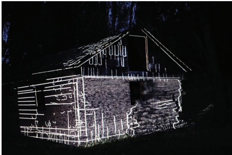
Figura 5: Proyección de líneas geométricas sobre el inmueble de propiedad de Galvarino San Martín Burgos, Puerto Guadal, comuna de Chile Chico, región de Aysén. Imagen digital (2022).

El proyectar imágenes y líneas geométricas que dan cuenta de una vida pasada, centrada en la ruralidad y alejada de la urbanidad (Figura 6), nos recalca que el ser humano en un devenir de peripecias y con su astucia, logra buscar y encontrar los medios necesarios para subsistir y transformar su entorno y adaptarlo a sus necesidades requeridas, en un ambiente agreste, de clima cambiante y de estaciones bien marcadas (Pallasma, 2022, p. 165-168; Sharr, 2015, p. 65-79), características propias del territorio aisenino en toda su extensión geográfica. En resumen, el boceto es una imagen temporal, un fragmento de acción cinematográfica registrada como una imagen gráfica, -la proyección- (Pallasma, 2014, p. 117-118).