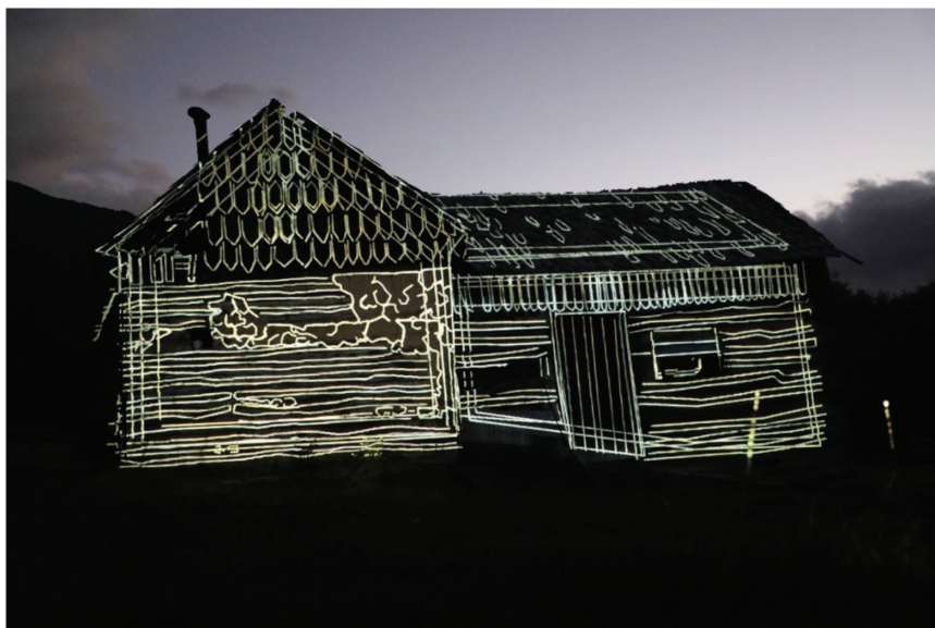
Figura 6: Proyección de líneas geométricas sobre el inmueble de propiedad de Adrián Delgado García, Mallín Grande, comuna de Chile Chico, región de Aysén. Imagen digital (2022).