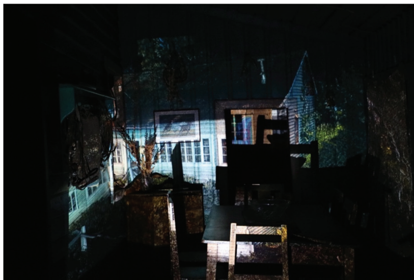
Figura 8: Proyección de la nube de puntos 3D al interior del comedor de la casa principal de propiedad de Soledad Solís Ehijos, Cerro galera, comuna de Coyhaique, región de Aysén. Imagen digital (2022).