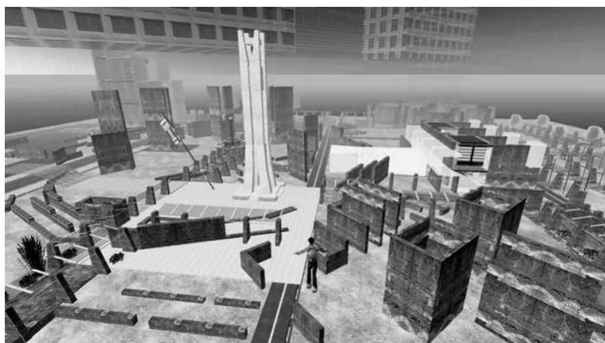
Figuras 6. Vista aérea del diseño completo de Diamond Island.

Reconectando los avatares con su pasado histórico dentro del mundo virtual de Second Life, habitando el espacio virtual como expresión de una civilización anterior. Este nuevo espacio sería localizado en el mundo virtual de Second Life como Diamond Island, el campus virtual de Temple University. Este espacio fue diseñado para brindar a los usuarios espacios lúdicos articulados, permitiéndoles realizar experimentos científicos y actividades potencialmente riesgosas en la realidad de manera hipotética en un mundo intangible. Construyendo un entorno virtual fácil de usar (Moneta, 2020, p. 43). Por lo tanto, vemos en esta vista aérea (Fig. 6) cómo la planificación urbana es meticulosa, con una disposición organizada de edificios y espacios abiertos. Reflejando parte de su inspiración en las calles de Filadelfia, conocidas por su cuadrícula ordenada y sus amplias avenidas, que facilitan la navegación y la accesibilidad.