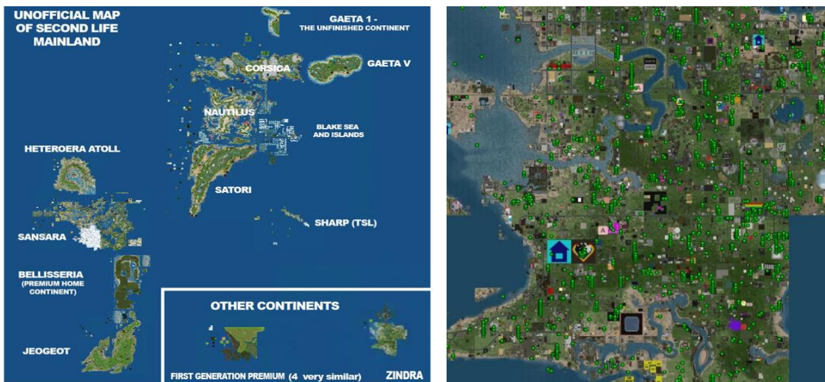
Figuras 1 y 2. (Izda). Mainlander, R. (2020). Parte del Continente en Second Life a través de Community [Fotografía]. Fuente: Second Life Community ; (Dcha). López Castillo, C. (2023). Detalle del Continente en Second Life [Fotografía]. Fuente: Second Life Community .

Prosigamos con el análisis más exhaustivo del mundo virtual The Second Life creado hace más de quince años (Fig.1). Nació como una ciudad fantasmal sin un contenido previo arquitectónico. Los usuarios o residentes tuvieron la oportunidad de crear objetos o intercambiar productos virtuales a través de un mercado abierto en línea a través de la moneda local Linden dólar. El objetivo inicial era que los avatares construyeran su propia comunidad social cimentando ellos mismos las construcciones arquitectónicas virtuales. Atrayendo inicialmente arquitectos y diseñadores de todo el mundo para experimentar con el terreno virtualizado. Exponiendo descampados a buen precio para dejar volar la creatividad de sus creadores sirviendo como puente de diseño entre la realidad y la virtualidad de este mundo primigenio. Aunque la realidad es que en 2015 esta ciudad virtualizada ha llegado a representar un PIB más elevado que muchos países pequeños físicos. Invirtiendo en esta nueva ciudad grandes empresas para incorporar sus marcas como Sony, Nissan, Coca Cola, General Motors, Intel, Microsoft, PSA Peugeot Citroën estableciendo sus negocios (Fig.2) en esta economía virtual (García, 2019).