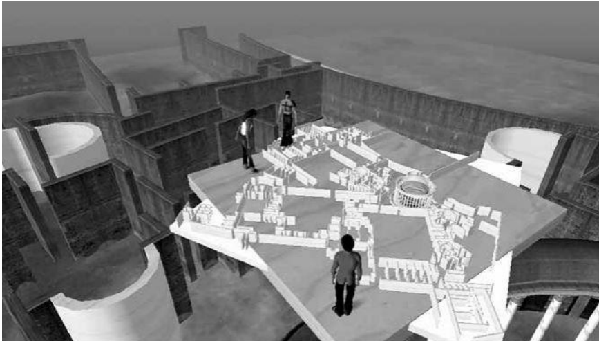
Figuras 5. Moneta, A. (2020). [Fotografía]. Reunión de diseñadores sobrevolando la obra en Second Life con el modelo 3D a escala de la Villa de Adriano.

En este caso, la villa se diseñó como una región privada dentro de la isla. Tomando como referente previo la arquitectura de la antigua Roma, específicamente el diseño del emperador romano Adriano en Tívoli, interpretando la construcción primigenia. Tomando como referencia su estructura constructiva, seleccionan cuidadosamente el contenido relevante para remodelar la nueva propiedad, generando así una sintaxis y semántica novedosa. Este proceso permite crear un significado nuevo conectado al material seleccionado, otorgándole una función semántica. En definitiva, se descontextualizan sus antiguas cualidades figurativas para producir una entidad arquitectónica completamente diferente en el mundo virtual, pero teniendo presente de manear intrínseca las influencias históricas reinterpretadas y adaptadas en el contexto de este mundo virtual, ofreciendo nuevas oportunidades para la innovación del diseño arquitectónico (Moneta, 2020, pp. 37-40).